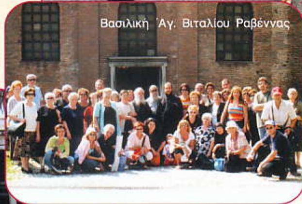
Βασιλικὴ Ἁγ. Βιταλίου Ραβέννας